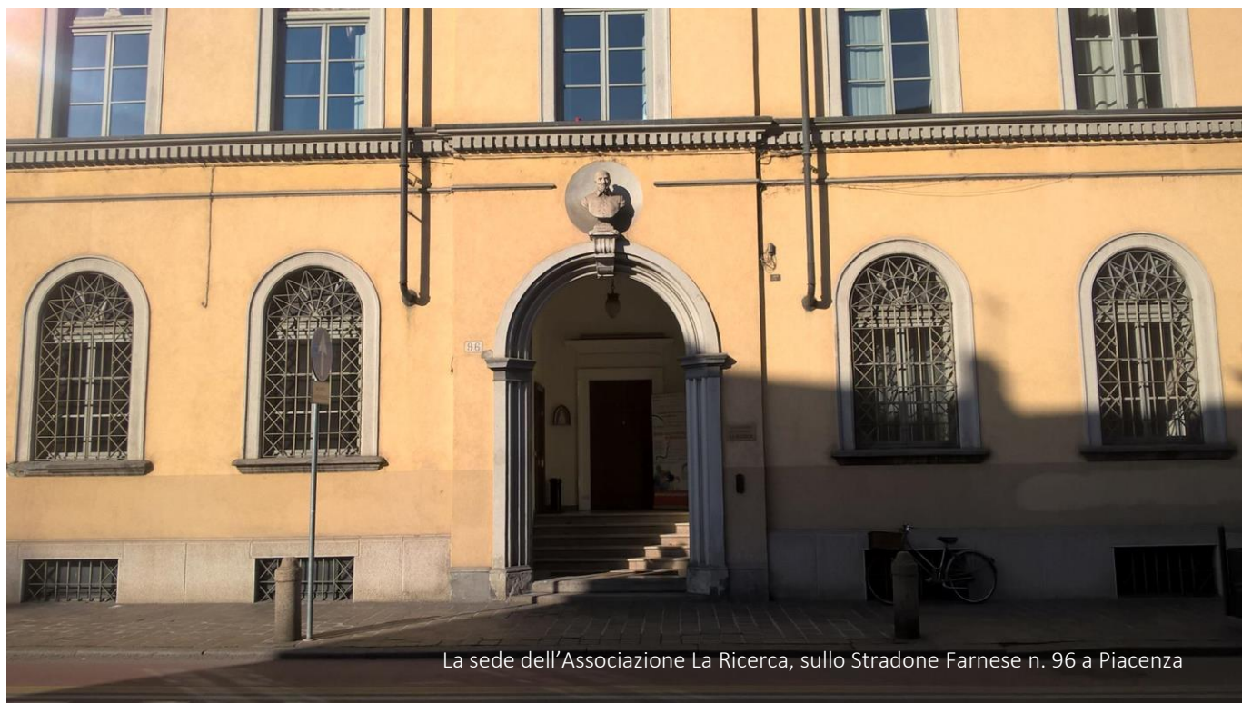
La sede dell’Associazione La Ricerca, sullo Stradone Farnese n. 96 a Piacenza